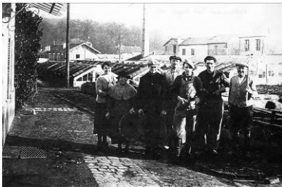
L'établissement P. Garet

Entre le Haut et le Bas du quartier s'étendent des champs de légumes, d'arbustes et de fleurs, faisant la richesse des