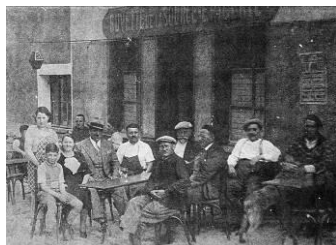
La buvette de la Source

« Je me souviens d'avoir joué et trempé mes bottines dans le ruisseau »