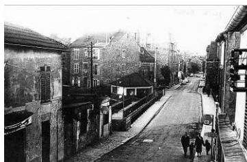
La halte de Montreuil