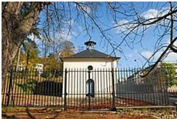
Le Pavillon des Filtres – Bassin de Picardie -

C'est en 1779 que le Régiment « Picardie » creuse l'avenue d'Orient ou de Ville d'Avray dont le sable et les gravats, venant recouvrir de façon heureuse l'ancienne voirie de Louis XV, vont finalement former la butte de Picardie. Cette avenue prendra le nom d'avenue des Etats-Unis en 1937.