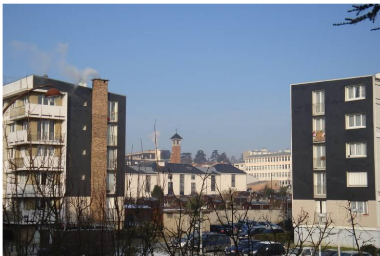
L'église Sainte Bernadette entourée des immeubles des petits bois, des jardins ouvriers, des locaux de Versailles Habitat et de l'école de la Source

Approximativement au centre de l'espace, l'Eglise Sainte Bernadette, entourée de part et d'autre des jardins ouvriers et du jardin paysagé de la Bonne Aventure, constitue un repère paisible mais pas encore séculaire.