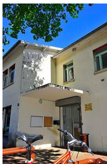
Maison de Quartier Bernard de Jussieu - Petits Bois - Picardie

Elle offre ses locaux à nombre de ces associations.